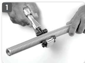
1 Couper le tuyau FLEXIPIPE avec coupe-tube adapté