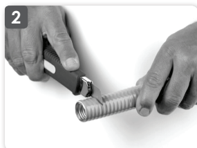
2 Dénuder le FLEXIPIPE à l'aide d'un cutter