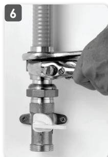
6 Terminer le serrage en butée