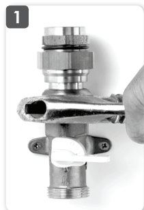
1 Monter le raccord FLEXICLIC sur le robinet

Avant la pose de la bande jaune autoadhésive, bien veiller à nettoyer et à sécher le raccord en enlevant le produit moussant utilisé pour le contrôle d'étanchéité.