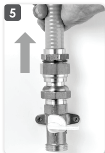
5 Contrôler l'enclenchement du tuyau FLEXIPIPE par traction