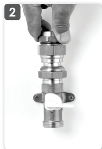
2 Desserrer l'écrou d'1/4 de tour