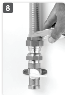
8 Après avoir effectué le test d'étanchéité, poser la bande jaune autoadhésive