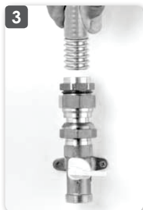
3 Engager le FLEXIPIPE jusqu'à enclenchement