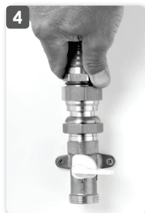
4 Serrer l'écrou pour bloquer le tuyau FLEXIPIPE